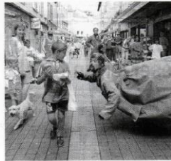
Monsieur Culbuto, ce monstrueux hybride, mi-homme mi-jouet.

La seule raison d'être de Monsieur Culbuto est de rouler sur lui-même, pour remplir sa mission de culbuto. Pour cela, il n'est d'ailleurs pas seul, aide qu'il est dans cette tâche par un fidèle manutentionnaire, tout droit sorti d'un film muet, qui se charge de le tracter de rue en rue, à l'aide d'un étrange chariot. Culbuto est, en effet, un coiffe d'acier de 520 kg, un poids qui l'empêche d'entreprendre des trajets supérieurs à quelques centimètres. Une condition dont il semble souffrir, si l'on se réfère à ses yeux qui semblent n'avoir de cesse à vouloir sortir de leurs orbites. Monsieur Culbuto se voudrait