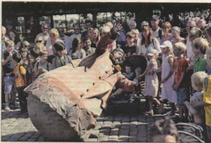
Mr. Culbuto på Axtorv. Børnene hvinde, når tumlingen lander omkring med sin 300 kilo tunge jernkugle i stedet for fødder.