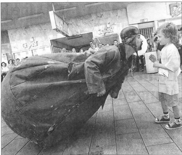
Stehaufmännchen "Monsieur Culbuto", einer der Straßen-Aktionen bei "Perspectives" schaut aus wie ein erwachsenes geordnetes Spielzeug aus dem Kinderzimmer. Mit seinem gewaltigen Kugelbauch erinnert er an ein großes Stehaufmännchen. Mai schwankt er wild hin und her, wie eine Bijs auf eintrischen Wellen. Mai sieht er still und sein trauriger Blick scheint zu sagen: Spiel mit mir.

Festival Perspectives SAARBRÜCKEN 15.16 & 17 mai 1998