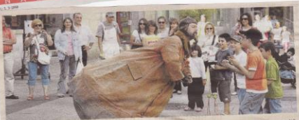
Una bola humana muy juguetona. La compañía francesa Dynamopop presentó ayer en diferentes puntos de la ciudad el singular espectáculo de calle "Monsieur Culbuto", un curioso personaje nacido de la unión entre un hombre y una inmensa bola de 520 kilos de peso cuya única obsesión es poder jugar con el público. Y realmente lo consigue, aunque no sin algunos problemas y situaciones divertidas.

V FESTIVAL INTERNACIONAL DE LAS ARTES DE CASTILLA Y LEÓN