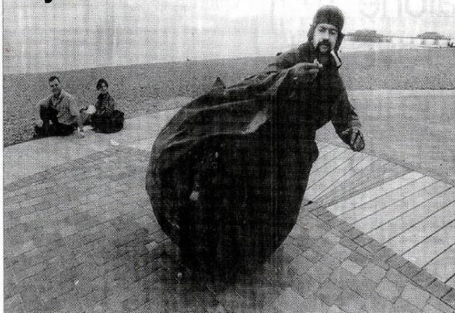
A giant weeble man performing at the National Street Arts Festival in Brighton.